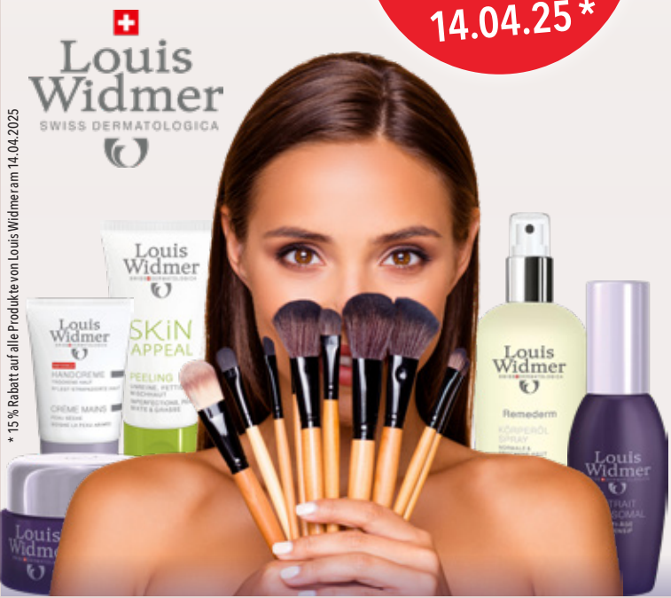
* 15% Rabatt auf alle Produkte von Louis Widmer am 14.04.2025